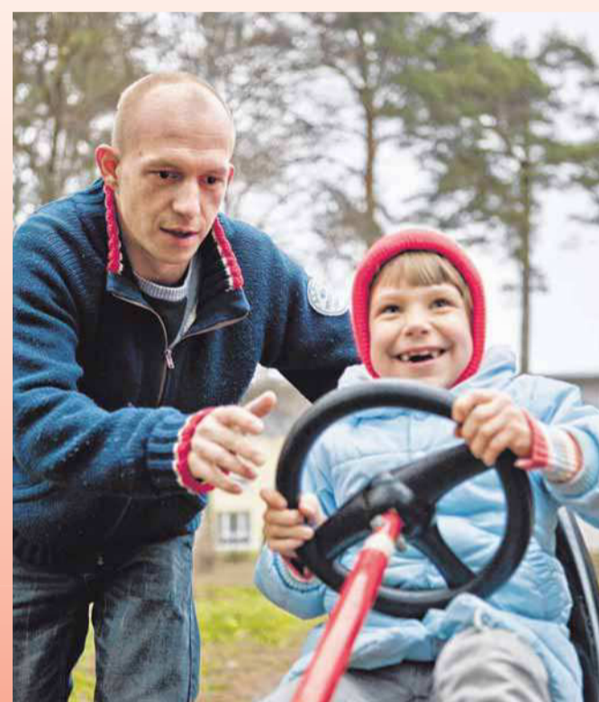
Hilfsorganisationen suchen regelmäßig Leute für den BFD und das FSJ.

An einem FSJ sind immer drei „Parteien“ beteiligt: ein/e Freiwillige/-r, eine Einsatzstelle, wo man in einem bestimmten Einsatzbereich arbeitet, und ein Träger.